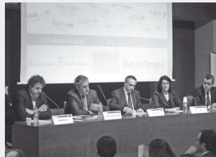
50 anys del Tractat de Roma a Terrassa. 27 de març de 2007