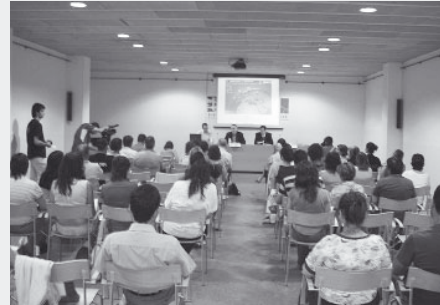
Curs UE Terrassa. Juny de 2007