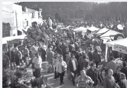
Fira de Nadal, Canyelles. Desembre de 2007