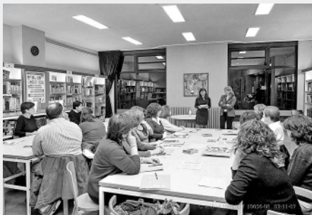
Curs UE Vilafranca del Penedès. Novembre de 2007