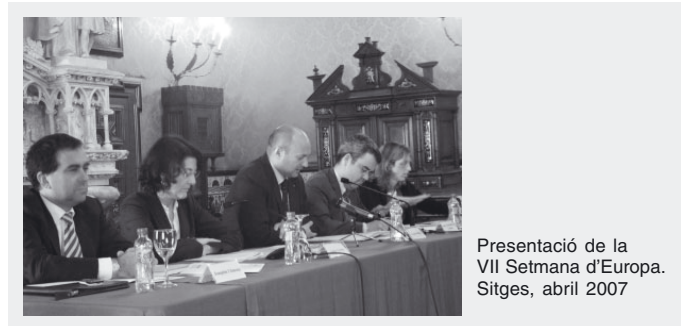
Presentació de la VII Setmana d'Europa. Sitges, abril 2007