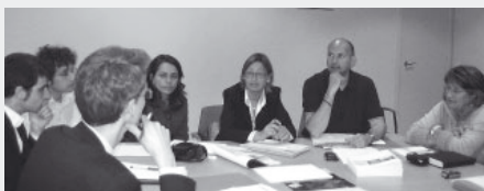
Consell Comarcal del Garraf. 3 de maig de 2007