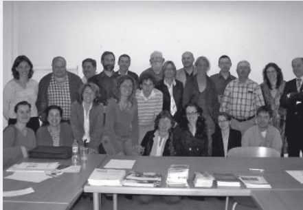
Curs UE Sitges-Garraf. Maig de 2007