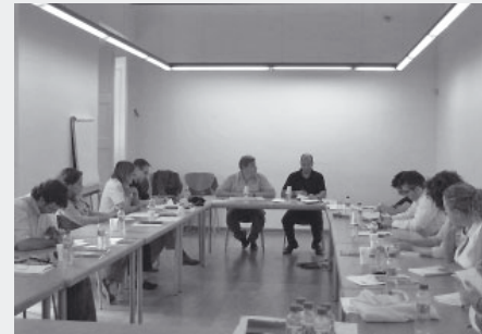
Sitges. 3 d'octubre de 2007