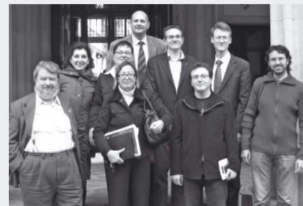
Terrassa. 21 de febrer de 2008