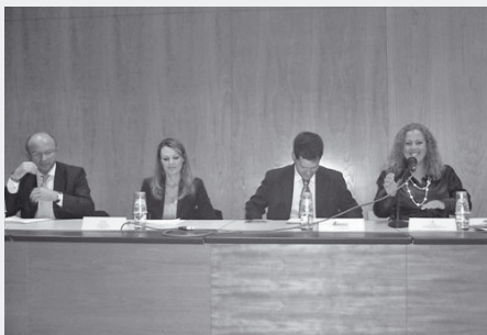
Conferència a Sant Pere de Ribes. 19 de novembre de 2007