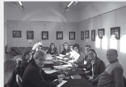
Sant Pere de Ribes. 11 de desembre de 2007