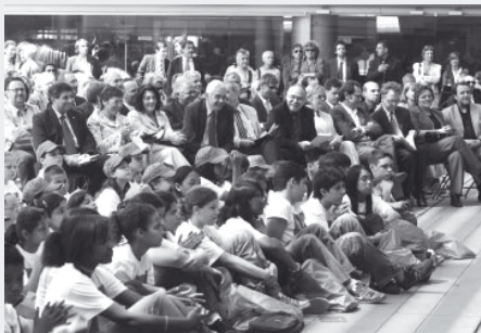
Acte institucional del Dia d'Europa a Barcelona. 9 de maig de 2007