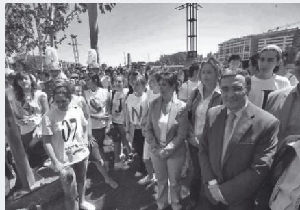
Acte institucional del Dia d'Europa a Lleida. 9 de maig de 2007