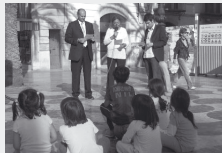
Festa d'Europa a Vilanova i la Geltrú. 9 de maig de 2007