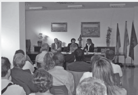
Taula rodona a Cubelles. 7 de maig de 2007